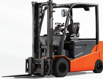
رافعة كهربائية / 1-3.5 طن