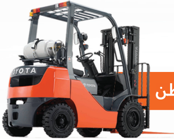
رافعة غازية / 1-8 طن