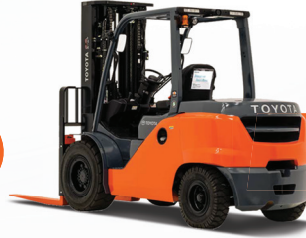
رافعة ديزل / 1-8 طن